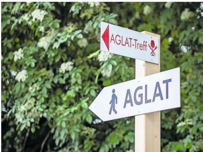
Orientierung: Wegweiser auf dem Aussengelände zeigten den Weg an.