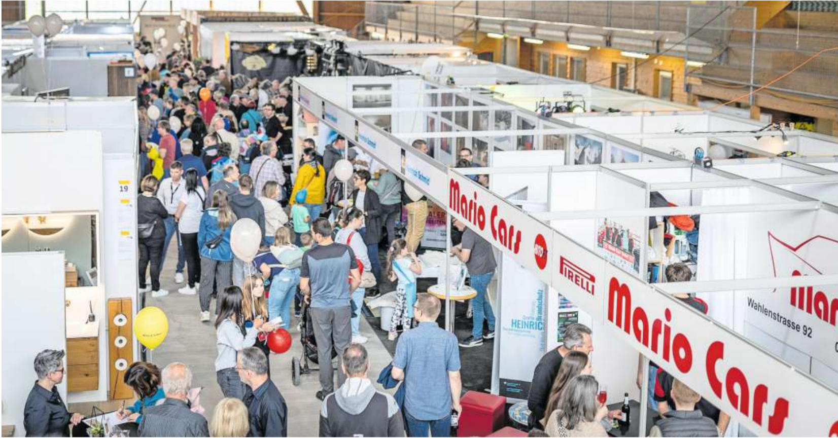
Menschenmenge: In der Eishalle herrschte reges Treiben.