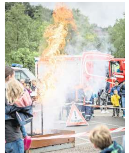
Feuer: Auf dem Aussengelände demonstrierte die Feuerwehr die Löschung eines Fettbrandes.