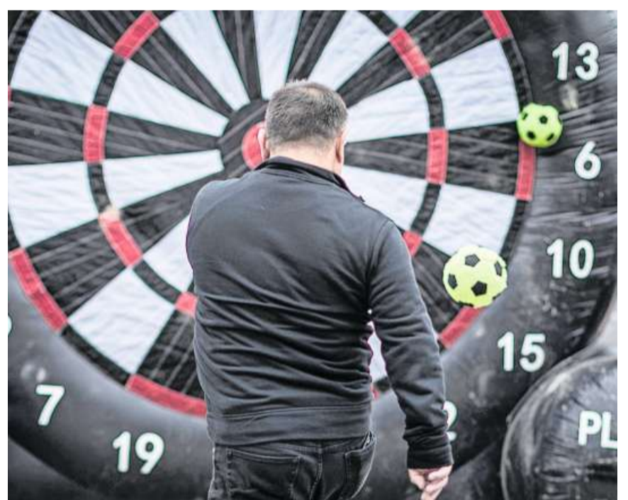
Dartsport: Ein Mitarbeiter der Firma Jost AG spielte den Dart-Fussball gleich selber.