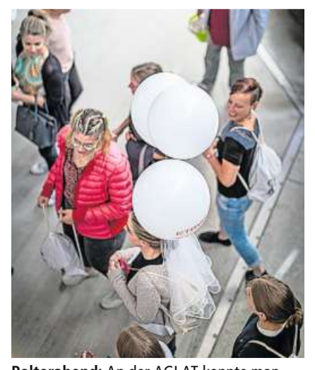
Polterabend: An der AGLAT konnte man sogar eine Braut und ihre Polterabend-Gruppe antreffen.