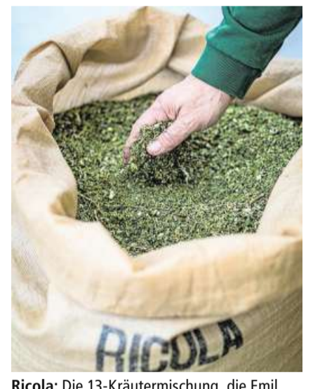
Ricola: Die 13-Kräutermischung, die Emil Richterich in den 1940ern erfand.