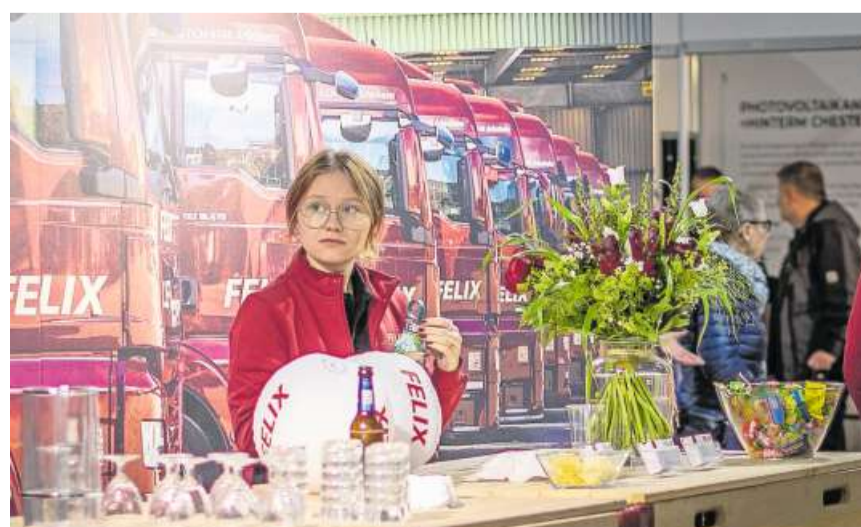
Nachhaltigkeit: Die Felix Transport AG präsentierte sich im Green Village; draussen konnte ein Elektro-Lkw der Firma bewundert werden.