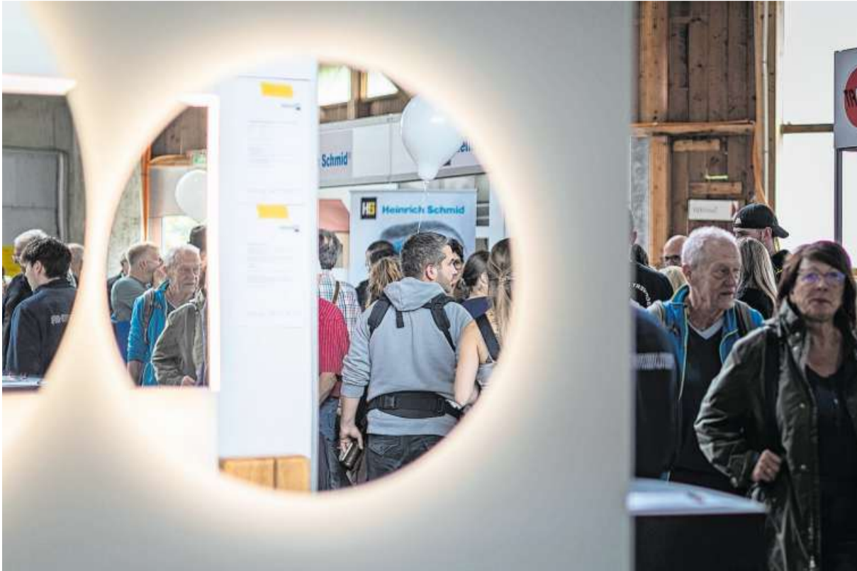
Kaum ein Durchkommen: Viel Traffic in der Eishalle.