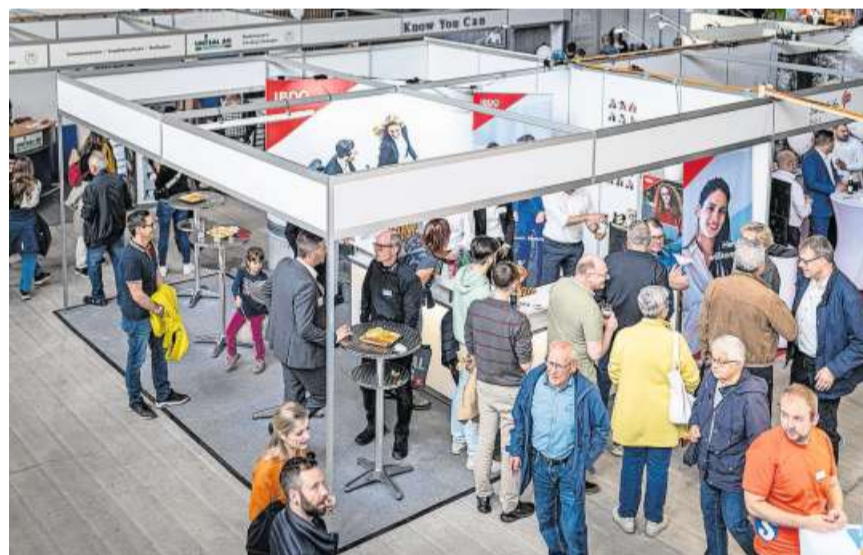
Einblick: Ein Stand in der Eishalle von oben.