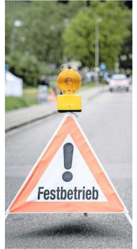
Fussgängerzone: Zwischen dem Blaulicht-Dorf und dem Festgelände war die Naustrasse gesperrt.