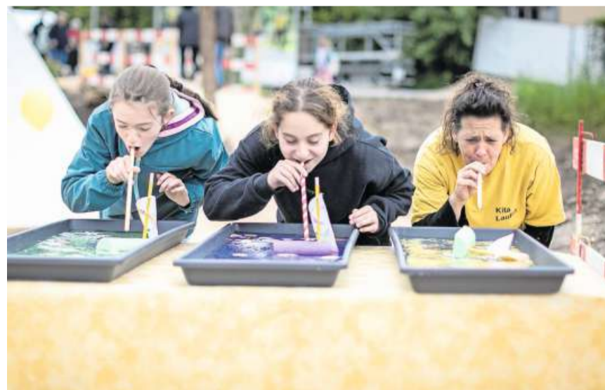
Spass: Der Kinderhort der Kita Laufen kümmerte sich um die Kinder.