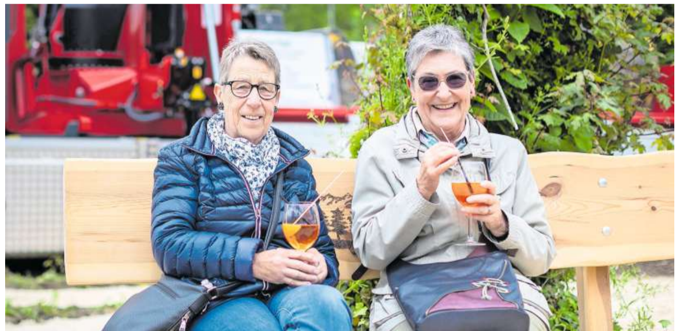
Pause: Zwei Besucherinnen genossen die AGLAT im Aussenbereich.