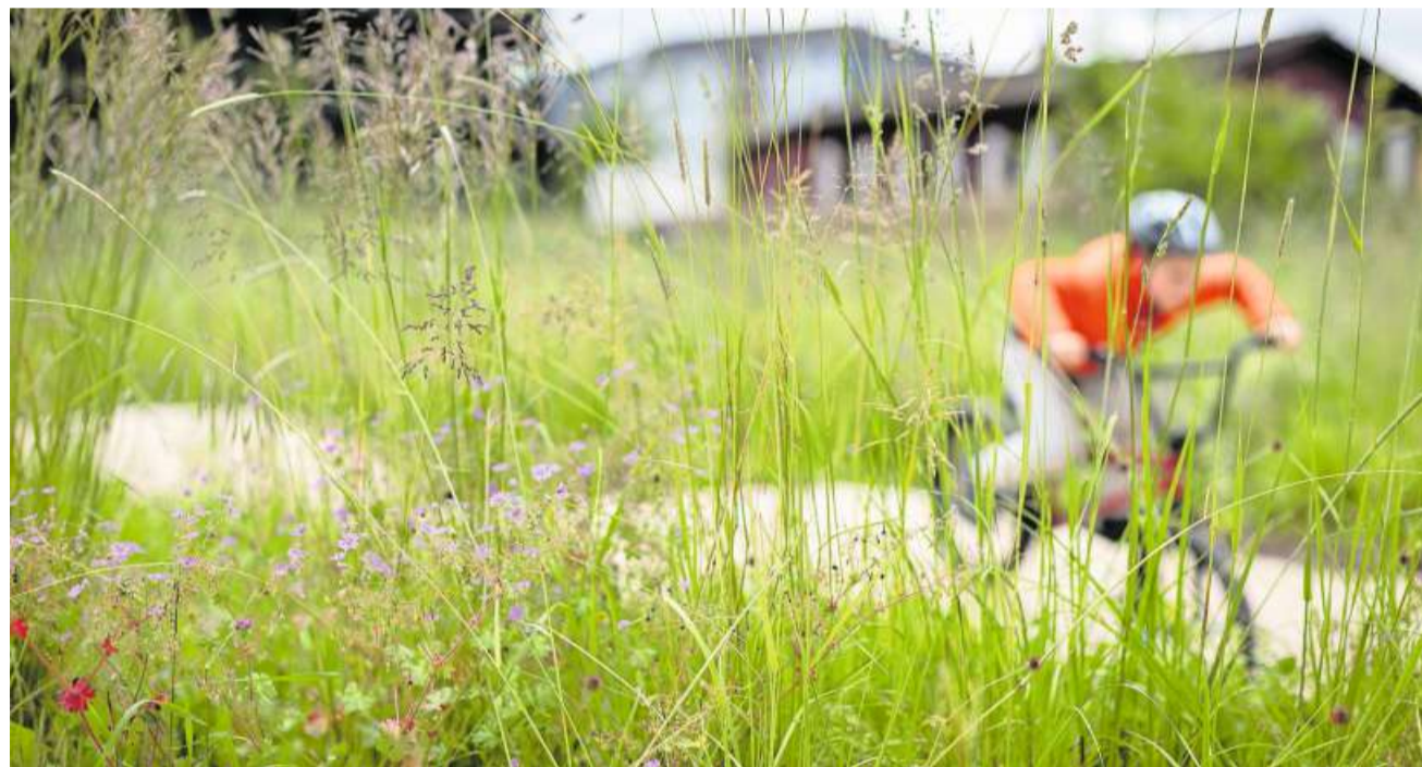
Velosport: Im Aussenbereich wurde für aufgeweckte Kids ein Pumtrack gebaut.