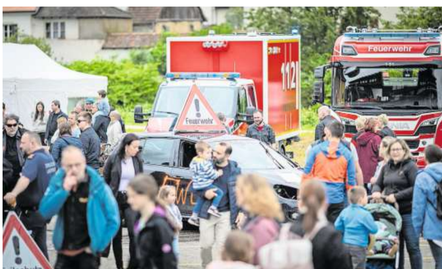
Blaulicht-Dorf: Die Aktionen von Feuerwehr, Notruf oder Zivilschutz auf dem Aussengelände zogen viele Schaulustige an.