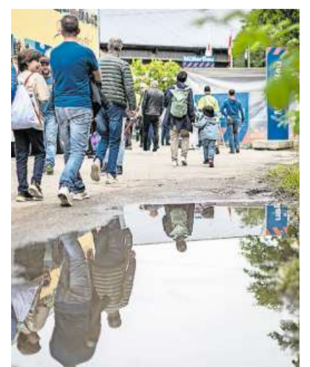
Wasser: Der Regen hinterliess seine Spuren.