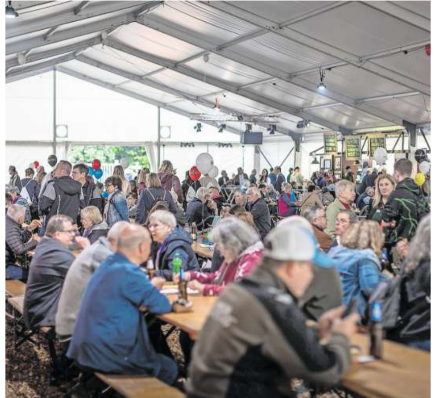
Verpflegung: Die Halle mit den Verpflegungsständen war gut gefüllt.