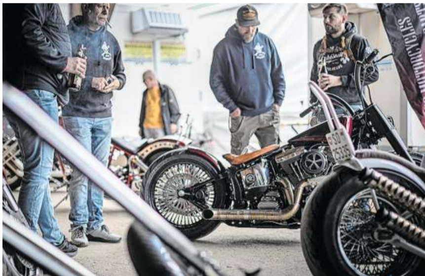
Stauen: Die AOC Motorcycles aus Breitenbach stellte diverse Custombikes aus, die für Gesprächsstoff sorgten.